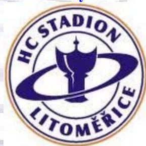
HC Stadion Litoměřice: Nováček s velkými ambicemi