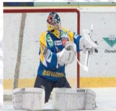
TOP 10 Brankářů